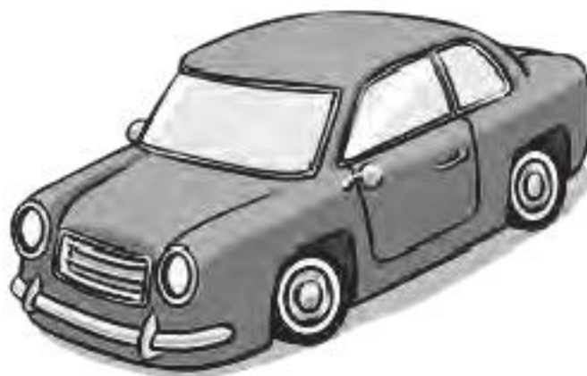
OTRO BANCONAN Te cu Afl. 818 pa luna